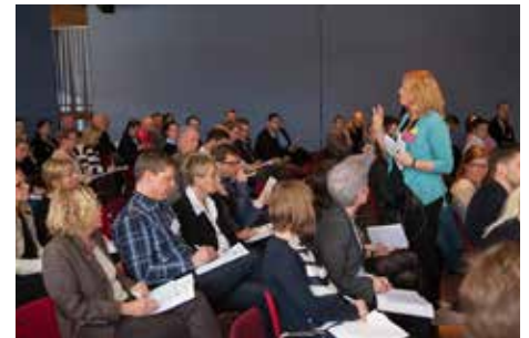
2015 års konferens i Södertälje var uppskattad "En mycket bra konferens som gav inspiration, kontakter och idéer" var ett omdöme.