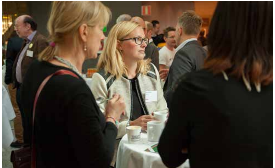
Missa inte årets viktigaste mötesplats och inspirationskälla för yrkesverksamma inom logistik, supply chain, produktion och verksamhetsförbättring.

Konferensen hålls den 26–27 april på Lind-