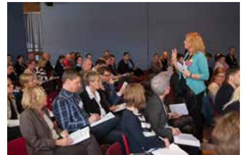
2015 års konferens i Södertälje var uppskattad "En mycket bra konferens som gav inspiration, kontakter och idéer" var ett omdöme.